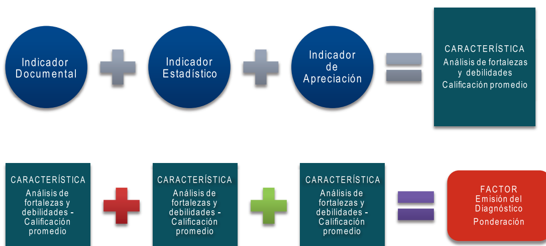
Ilustración 2. Procedimiento de análisis

Este balance del plan de mejoramiento no sólo consiste en establecer el resultado o compromiso plasmado en el plan de mejoramiento “ lo que se hizo ”, sino el impacto que tuvo en el programa en beneficio de la calidad. A la hora de realizar el balance de la mejora, debe revisarse la Resolución de Acreditación de alta calidad nacional y/o internacional, el informe de evaluación externa nacional y/o internacional, y los informes de gestión (programa, departamento o escuela y facultad).